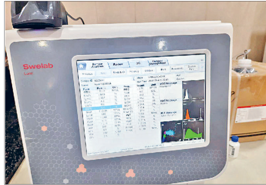
सोनीपत। अस्पताल में दान की गई मशीन।