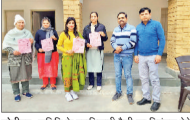
सोनीपत। समिति के पदाधिकारी रैली का निमंत्रण देते हुए।