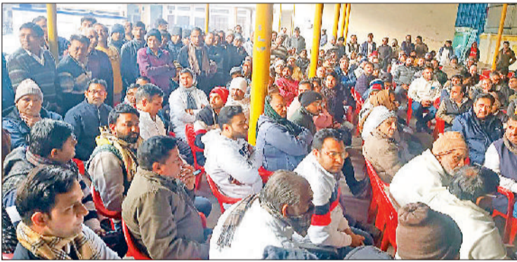
सोनीपत। बैठक में रणनीति तैयार करते व्यापारी।

पुलिस ने दो आरोपितों को प्रोडक्शन वारंट पर लिया, पूछताछ चल रही