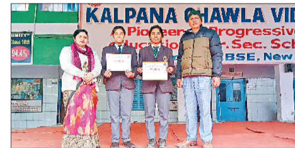
खरखोदा। छात्रों को नकद राशि व प्रमाण पत्र देते शिक्षक।