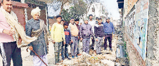
गन्नीौर। बह रहे दूषित पानी को दिखाते स्थानीय लोग।