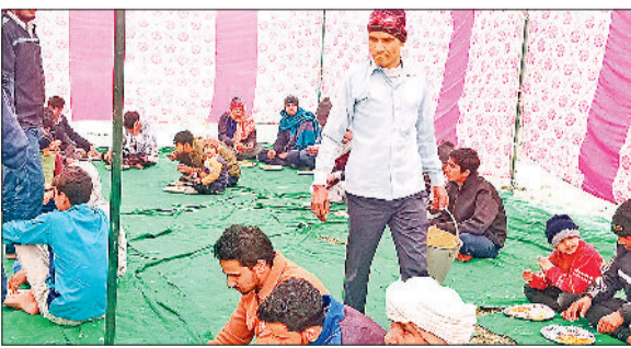
गनौर। भंडारे में प्रसाद ग्रहण करते श्रद्धालु।