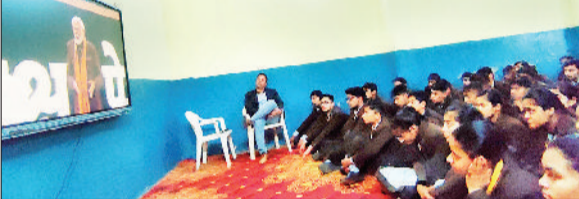
गोहाना। परीक्षा पर चर्चा का सीधा प्रसारण देखते हुए विद्यार्थी।