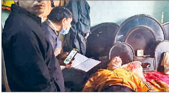
सोनीपत। घटनास्थल पर जांच करते पुलिस अधिकारी।