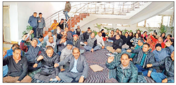
सोनीपत। मुखल विवि में धरना देते हुए शिक्षकगण।