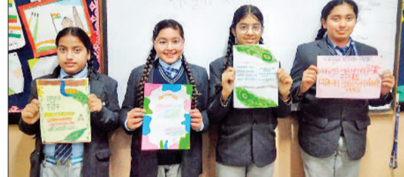
सोनीपत। ब्राइट स्कॉलर में प्रतियोगिता में प्रतिभागी अपनी रचना दिखाते हुए।