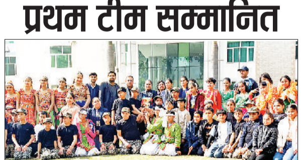
गोहाना। विजेता टीम के विद्यार्थी अपने गुरुजनों के साथ।