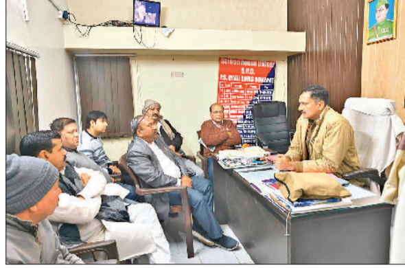
सोनीपत। पुलिस थाने में पहुंचे व्यापारियों से बातचीत करते हुए थाना प्रभारी।

सिविल लाइन थाना क्षेत्र के सब्जी मंडी में मंडी प्रधान व अन्य आदतों की दुकान से लाखों रुपये की राशि के चोरी होने का मामला सामने आया है। पीड़ितों ने मामले की शिकायत पुलिस को देकर दुकानों पर काम करने वाले नौकरों पर चोरी की वारदातों को अंजाम देने का आरोप लगाया है। पुलिस ने इस संबंध में अलग-अलग दो मुकदमों दर्ज कर लिए हैं। पुलिस ने सीसीटीवी की रिकार्डिंग कब्जे में लेकर आरोपितों की तलाश शुरू कर दी है। पुलिस मामले की गंभीरता से जांच कर रही है। वारदात के बाद व्यापारियों ने थाना सिविल लाइन प्रभारी से मुलाकात कर गश्त बढ़ाने व चोरी के आरोपियों को गिरफ्तार करने की मांग की है।